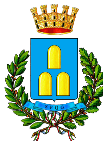
COMUNE DI ZAGAROLO